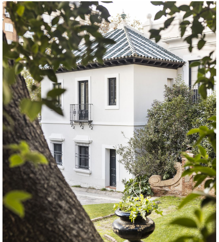
Pabellón de invitados, ubicado junto a la entrada de Francisco Silvela 82.

de haber asumido el mismo reto 59 veces antes. Es por eso por lo que estamos convencidos de que Casa Decor 2024 será una edición mágica, singular, fascinante y distinta a las anteriores. Porque no hay un Casa Decor igual que otro, ni hay nada como Casa Decor.